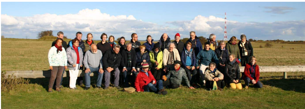
De deelnemers aan de excursie naar Noord-Friesland op Sult.