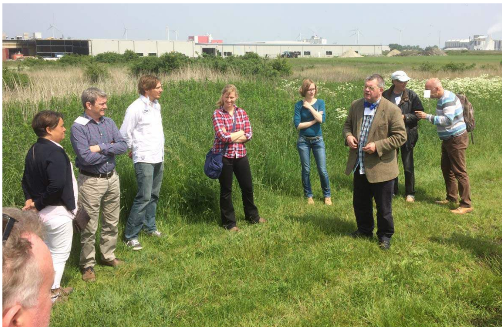
De voorzitter vertelt op locatie over de opgravingen die in de jaren 1980 plaatsvonden in de wierde Heveskesklooster.

Op 28 mei vond een feestelijke algemene jaarvergadering plaats in theater De Molenberg in Delfzijl. Deze locatie werd gekozen omdat er in de omgeving van Delfzijl twee belangrijke opgravingen zijn uitgevoerd, in Heveskesklooster en in De Wierhuizen. Ten behoeve van een opgraving in De Wierhuizen door Van Giffen werd de Vereniging voor Terpenonderzoek in 1916 opgericht. Na een kort formeel gedeelte bestond het programma uit een aantal lezingen en een veiling waarin een aantal ingebrachte kunstwerken werd geveild ten bate van de verenigingskas. Na de lunch was er een excursie per bus naar de opgravingsterreinen Heveskesklooster en Wierhuizen. Daarna werd nog het Muzeeaquarium bezocht, waar het onder de wierde van Heveskes gevonden hunebed en andere vondsten uit deze opgraving waren te bewonderen.