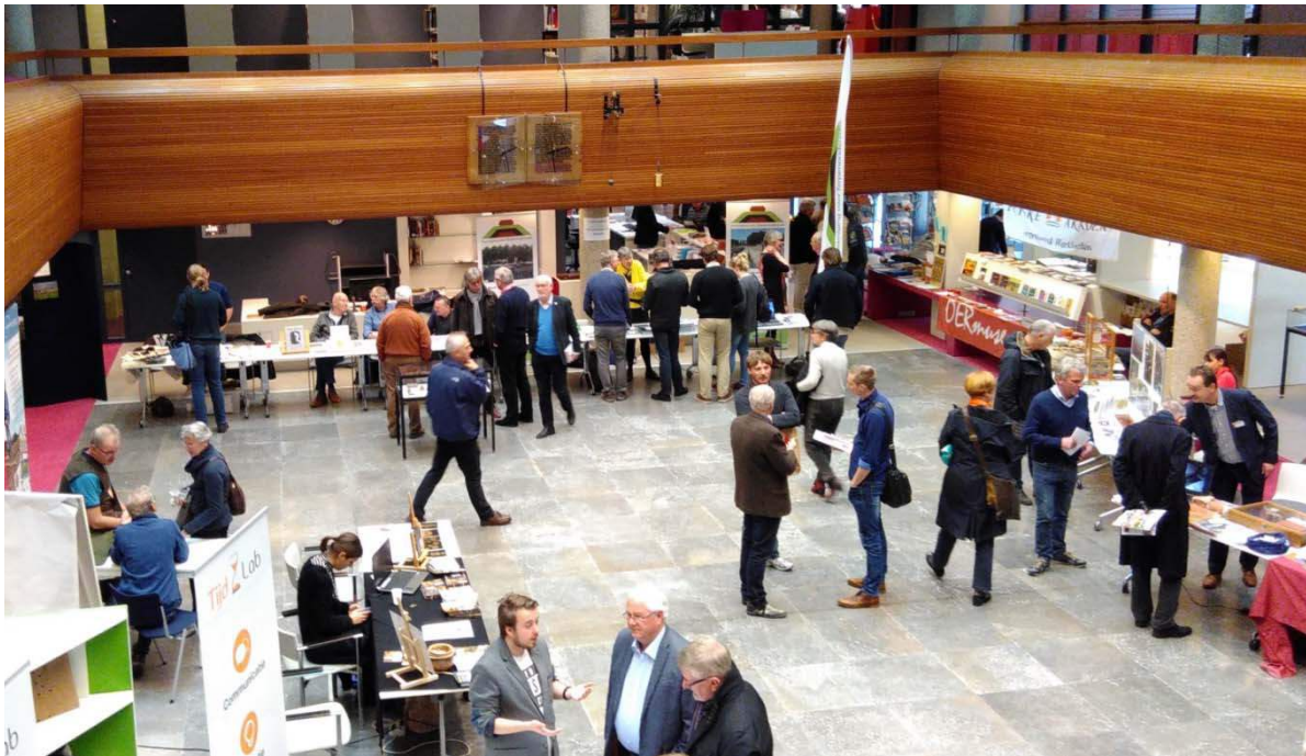
De Dag van de Noord-Nederlandse Archeologie in Tresoar in Leeuwarden, met de stand van de Vereniging.

Op 28 mei vond een feestelijke algemene jaarvergadering plaats in theater De Molenberg in Delfzijl. Deze locatie werd gekozen omdat er in de omgeving van Delfzijl twee belangrijke opgravingen zijn uitgevoerd, in Heveskesklooster en in De Wierhuizen. Ten behoeve van een opgraving in De Wierhuizen door Van Giffen werd de Vereniging voor Terpenonderzoek in 1916 opgericht. Na een kort formeel gedeelte bestond het programma uit een aantal lezingen en een veiling waarin een aantal ingebrachte kunstwerken werd geveild ten bate van de verenigingskas. Na de lunch was er een excursie per bus naar de opgravingsterreinen Heveskesklooster en Wierhuizen. Daarna werd nog het Muzeeaquarium bezocht, waar het onder de wierde van Heveskes gevonden hunebed en andere vondsten uit deze opgraving waren te bewonderen.