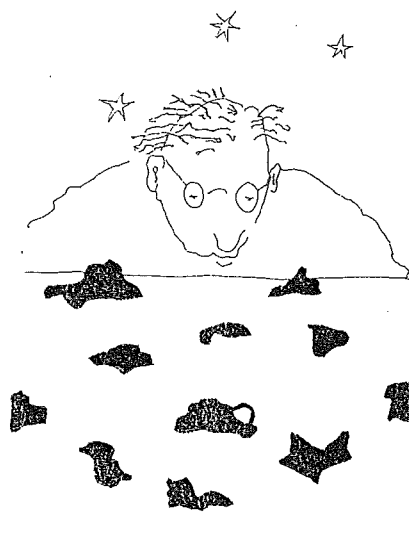
De auteur aan het werk

den (niet-leden 65 gulden) inclusief verzendkosten. Het is een prachtig boek geworden, dankzij de soepele stijl van de schrijver leest het prettig en dat ondanks de weerbarstige materie.