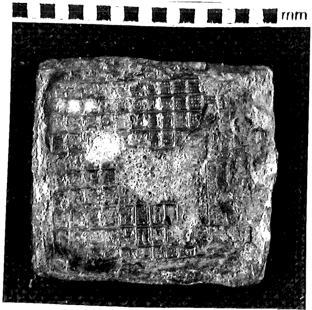
Foto van de matrijs van Wijnaldum