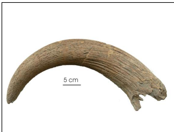
Horenpit van oerosstier uit Holwerd.

De oeroshoren uit Holwerd maakt duidelijk dat de oeros in de Merovingische periode nog op de Friese kwelders leefde. De oeros stief uit door concurrentie met het huisrund en door bejaging. De laatste oeros stierf in Polen, in 1627. Onze huisrunderen stammen af van oerosen die in het Nabije Oosten leefden. Oerosbotten zijn in Oostergo eveneens aangetroffen in de terpen Goutum, Britsum (een vrijwel compleet skelet), Raard, Oosterbeintum en Ferwerd. Het oerosskelet uit Britsum, eveneens van een stier, dateert uit 257-421 na Chr. (Prummel, 2006). Twee oerosbotten werden aangetroffen in terpen in Westergo in Friesland: Berlikum en Dongjum (voorlopige datering: Merovingische periode).