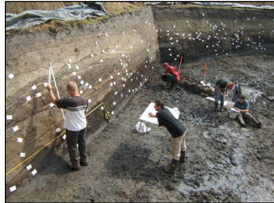
Sfeerfoto van het steilkantonderzoek bij Anjum, in de zomer van 2006.

Het blootleggen van het nog resterende talud van deels afgegraven terpen en wierden heeft het afgelopen decennium belangrijk nieuwe inzichten opgeleverd over de bewoningsgeschiedenis van het kustgebied. Zo weten we nu dat de bewoning in noordelijk Westergo vooraf werd gedaan door de aanleg van dijken, vermoedelijk voor de bescherming van zomerweiden, en dat woonstalhuizen veelal op rechthoekige, rondom met plagen verstevigde podia stonden.