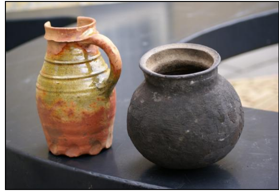
De vondsten die Yep Hettinga deed toen hij na afloop van het onderzoek nog een waterput leegmaakte.