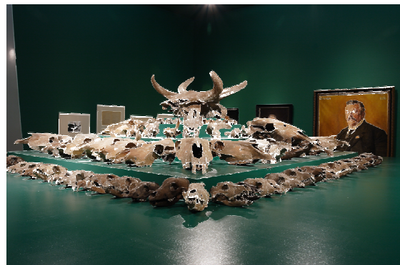
De piramide van dierschedels met twee oerosschedels uit Eenumerhoogte in top.