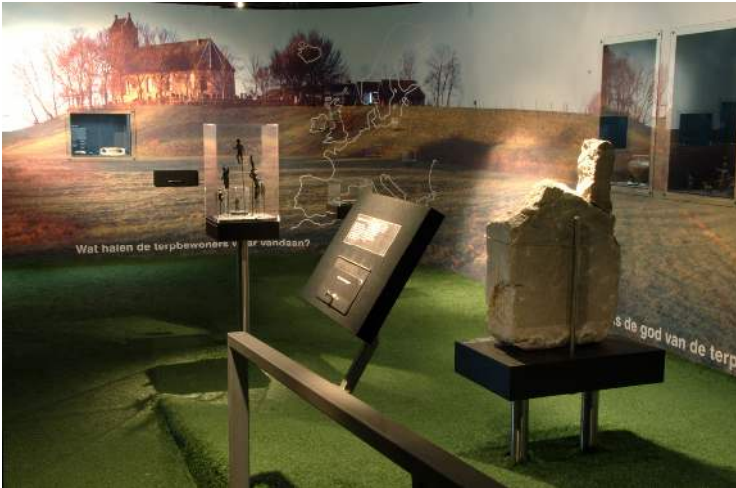
Een kijkje in de tentoonstelling Super Terpen in het Fries Museum (Leeuwarden).

periode van 600 v. Chr. tot ongeveer 1000 na Chr. deze kunstmatig opgeworpen heuvels bewoonden. In de presentatie staat de geschiedenis van leven én overleven op de terp centraal. Een meterslange panoramafoto, animaties en geluidsfragmenten nemen je als bezoeker mee naar de terpentijd. En natuurlijk staan in 'Super Terpen' de topstukken uit de archeologische collectie van het Fries Museum in de schijnwerpers, zoals de mantelspeld van Wijnaldum en het boomkistgraf. De presentatie heeft met diverse doe-dingen een sterk educatief karakter. De langlopende presentatie is vormgegeven door ontwerpbureau Kossmann & De Jong uit Amsterdam.