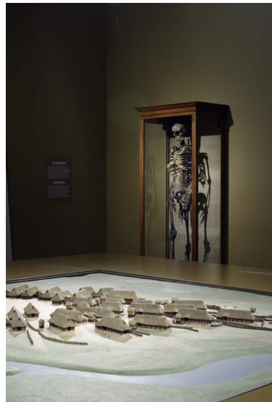
De maquette van de Feddersen Wierde (D.) en de gehangene uit Hatzum.