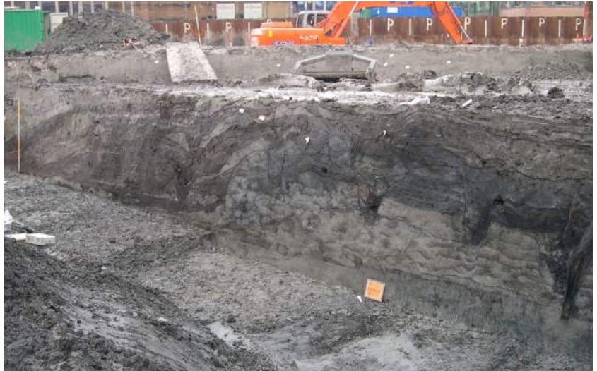
Doorsnede door het kernpodium in de zuidwesthoek. Goed herkenbaar zijn het podium van opstapelde plaggen, de mestlagen aan weerszijden hiervan en het houtwerk van één of meer woonstalhuizen uit de Romeinse periode.

De tentoonstelling was ook aanleiding voor een aantal publicaties. Allereerst natuurlijk het gelijknamige boek (zie boven). Het Groninger Museum gaf ook een gratis Groninger Museummagazine uit, het Groninger Forum een krant met alle activiteiten en de vereniging Stad en Lande een wierdennummer. Kortom de wierden zijn weer op de kaart gezet.