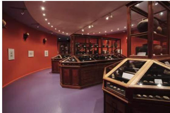
Beelden uit de tentoonstelling Professor van Giffen en het geheim van de wierden. Ovale zaal: de vitrines met wierdevondsten van de grondleggers van het wierdenonderzoek.

de mensen met het verleden kennis willen laten maken. Alle participerende instellingen hadden dan ook bijdragen aan het Van Giffen project.