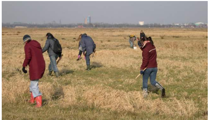
Eerstejaarsstudenten van de RuG op zoek naar molshopen met archeologische resten tijdens de veldverkenning in de Peizermeden.

Object van studie waren de in het gebied aanwezige middeleeuwse veenterpen. De terpen