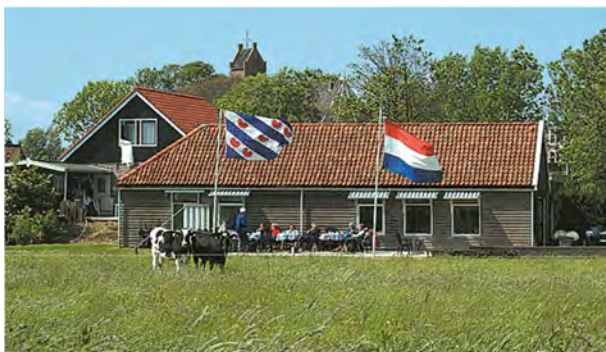
Het huidige bezoekerscentrum met op de achtergrond de 12 e -eeuwse Romaanse kerk

De aanleiding voor de nieuwbouwplannen is meerledig. Eind jaren 80 van de vorige eeuw zijn er grote herstelwerkzaamheden aan de verzakkende terp van Hegebeintum uitgevoerd. Dit na het voeren van een grote actie Redt Hegebeintum om het benodigde geld bij elkaar te krijgen. Tijdens die werkzaamheden werden er twee directieketen als "museum" ingericht (14-07-1989) met vondsten van Hegebeintum en het naburige Oosterbeintum. De inrichters waren onze leden Egge Knol en Evert Kramer.