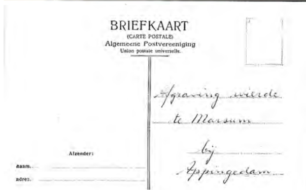
Voor- en achterzijde van de prentbriefkaart

Enige jaren terug kon op Marktplaats.nl een prachtige foto worden gekocht waarop aan de linkerkant een deel van de wierde nog overeind staat. De kerktoeren steekt net boven de bomen uit. De foto is afgedrukt op prentbriefkaartformaat met een deelstreep voor een adresdeel en een tekstdeel. Dat was het gevolg van een Koninklijk Besluit van 15 september 1905. Voordien mocht aan de achterzijde enkel een adres staan. Eventuele mededelingen moesten aan de voorzijde geschreven worden. De afdruk van de foto is derhalve van na die tijd. Onder