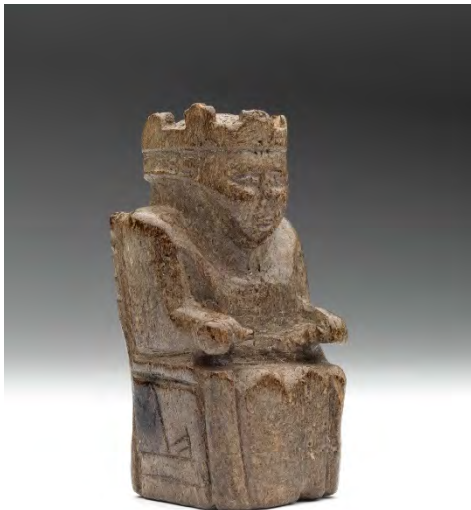
Koning uit een schaakspel, gevonden in Leeuwarden, 1100-1200. Fries Museum, Leeuwarden | Collectie Koninklijk Fries Genootschap.

Reizen over land was destijds in de Lage Landen niet eenvoudig. Het kustgebied en het binnenland waren van elkaar gescheiden door een dik pakket slecht toegankelijk veen. Voor de Friezen was het daarom makkelijker om per schip naar Denemarken te varen dan te voet naar Oldenzaal te reizen. Dat er in de vroege middeleeuwen naast handel ook uitwisseling van taal en cultuur rondom de Noordzee plaatsvond is dan ook niet verwonderlijk. Niet het land, maar het water vormde in die tijd de verbinding tussen gebieden. Het schip was belangrijk voor handel en de uitwisseling van sociale en culturele ideeën. Via de zee arriveerden echter ook op buit beluste Vikingen in Frisia. Sommige Friezen sloten zich vrijwillig aan bij deze vaak uit Scandinavië afkomstige piratenbendes. Wanneer je “op viking” ging, voer je samen met je wapenbroeders en mogelijk ook -zusters op een schip de zeeën over op zoek naar rijkdom en avontuur.