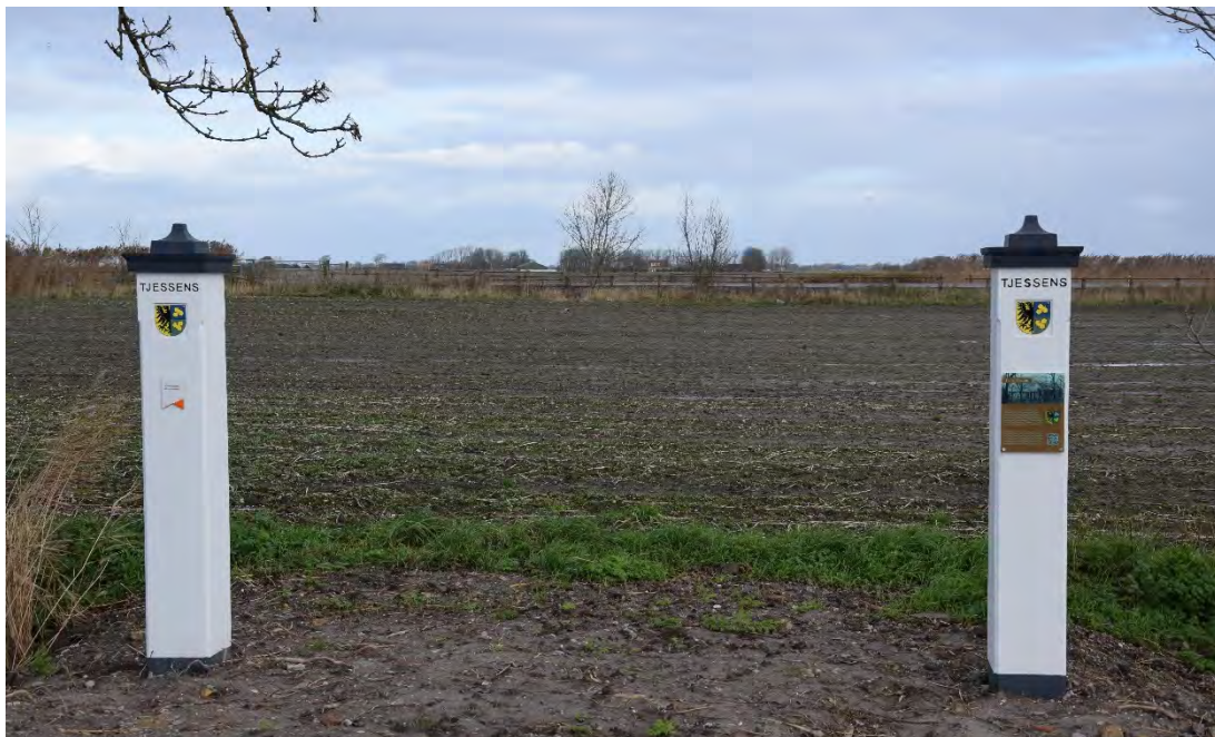
De hekpalen met zicht op de terp.

Dit is de eerste plek in Nederland waar een dergelijk experiment wordt uitgevoerd. De RCE volgt het experiment nauwgezet en doet jaarlijks hoogtemetingen om te bepalen of de ophogingslaag slijt. Tot nu toe zijn de resultaten bemoedigend.