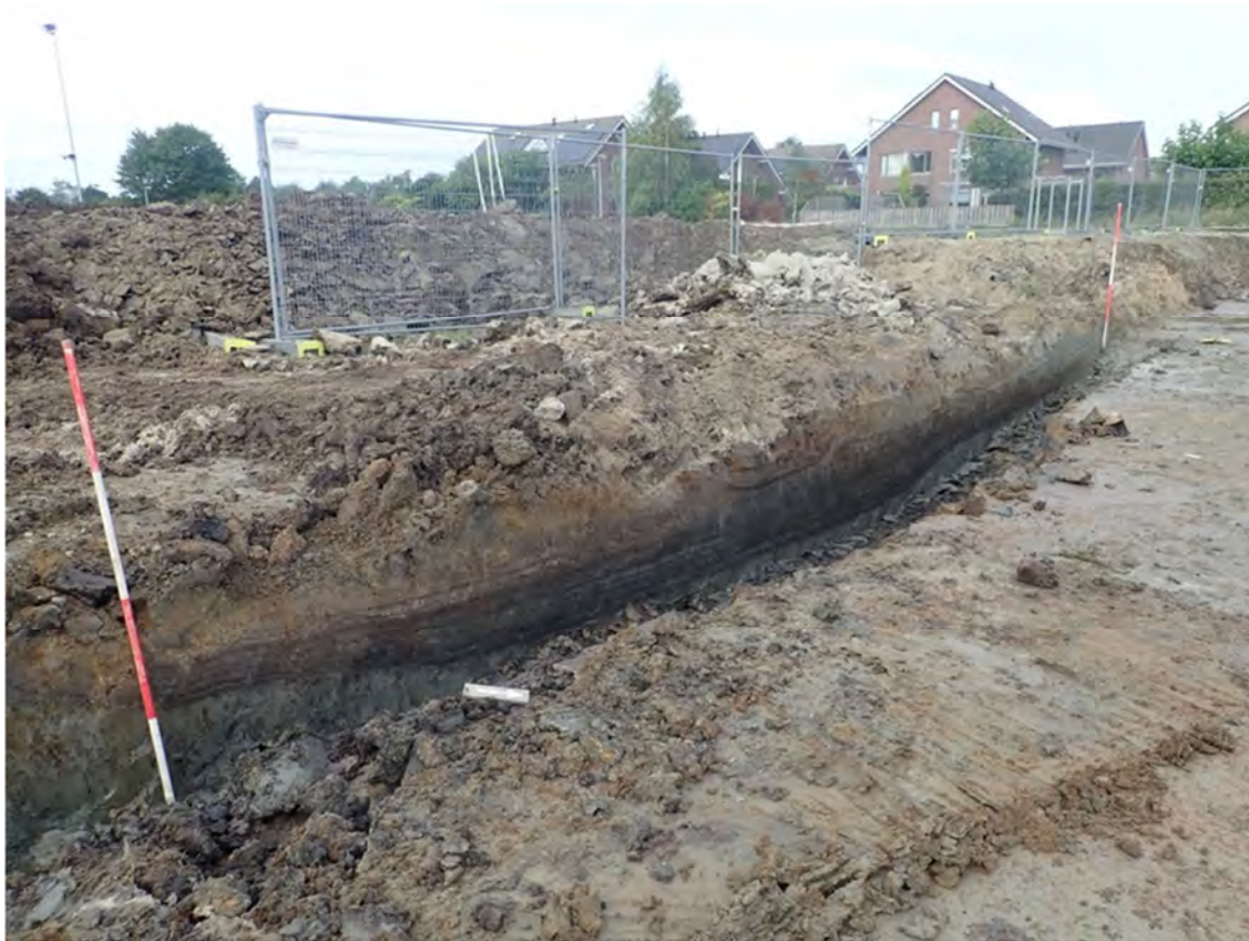
De Geul in het profiel.

meter. Vermoedelijk is de locatie door de mens in gebruik genomen, toen de betreffende geul al voor een aanzienlijk deel was verland. De hoogste vullingen blijken vertrapt door vee. Waarschijnlijk stond in deze fase nog slechts een dunne en dus waadbare laag water in de geul van slechts enkele decimeters.