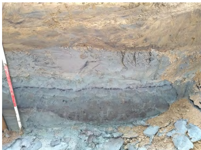
Een sloot in het profiel.