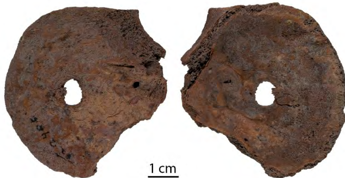
Uitgesneden en doorboord hersenpangedeelte van het rechtervoorhoofsbeen van een pasgeboren kalf uit Tritsum, vondstnummer 2405. Links: de buitenzijde, rechts: de binnenzijde van het bot.

In het jubileumjaarverslag van de Vereniging voor Terpenonderzoek berichtten Wietske Prummel en Arjan Hullegie over twee benen schijfjes gesneden uit voorhoofsbeenderen van pasgeboren kalveren uit Arkum en Groot-Saksenoord. De schijfjes zijn in het midden doorboord. Er is geen glans of slijtage van gebruik op de schijfjes te zien. Zij dateren uit respectievelijk de late ijzertijd of het begin van de vroeg-Romeinse tijd (op zijn laatst eind 1 e eeuw v.Chr.) en de late ijzertijd (200 v. Chr. – 50 n.Chr. Beide objecten werden aangetroffen in sloten (Prummel & Hullegie 2016).