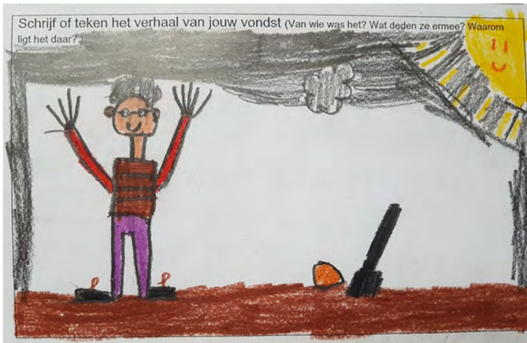
Tekening gemaakt door een van de basisschoolleerlingen

tekeningen, verhalen en gedichten en dit zal worden bijgevoegd bij het officiële rapport en ook als zodanig worden gepresenteerd en overhandigd aan de gemeente en provincie.