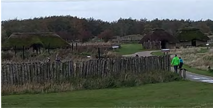
Het nagebouwde dorpje in het museum van Hjemsted.

Als derde bezoek ik het Museum Sønderjylland (zuid-Jutland) in Haderslev, waar ik een afspraak heb met één van de leidende onderzoekers voor zuid-Jutland. Het is geen groot museum. Het geeft wel een goed overzicht per periode en het is een mooie visuele tentoonstelling. Zo zijn er bijvoorbeeld reconstructies van graven, met de sets aan grafgraven die per type graf worden aangetroffen. Na een rondleiding gaan we naar de opgravingsdienst van het museum, waar ik opgravingsdocumentatie kan inzien. In Denemarken zijn het de musea die opgravingsbevoegdheid hebben en veel van de opgravingen uitvoeren. Vanuit Haderslev bezoeken we ook Hjemsted. Dat is een grote, belangrijke site uit dit gebied, waar op de locatie van de opgraving een