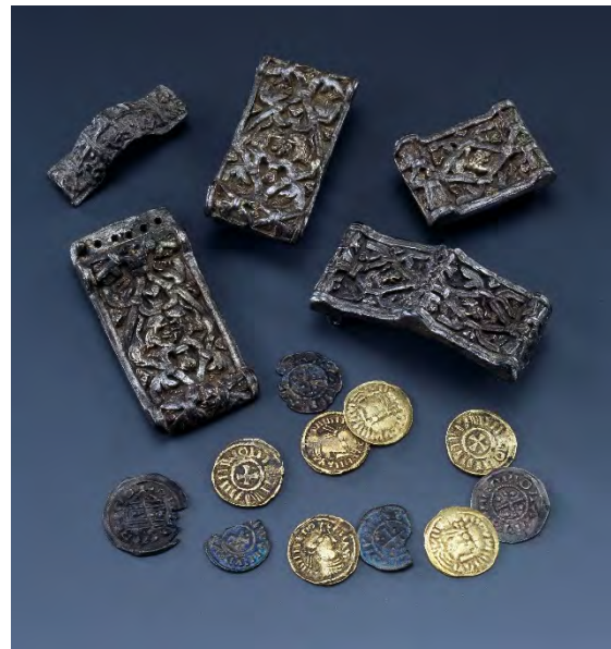
De schat van Marsum met de munten uit het Fries en het Groninger Museum.