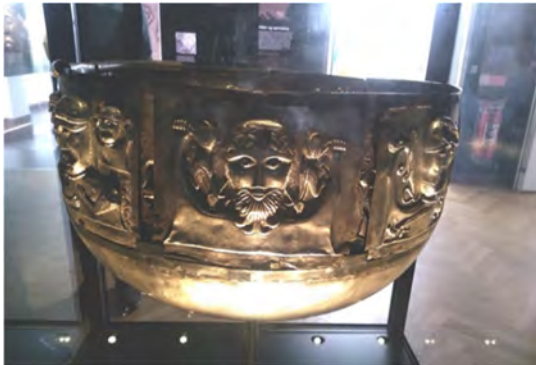
De Gundestrupketel.

Het Nationalmuseet in Kopenhagen is het grootste cultuurhistorische museum van Denemarken, met een prachtige collectie. Hieronder bevinden zich veel pronkstukken, zoals bijvoorbeeld de bekende Gundestrup ketel uit de 2de of 1ste eeuw v.Chr. Er is een enorme rijkdom aan metaalvondsten uitgesteld, uit allerlei perioden. Opvallend zijn ook de menshoge runenstenen uit de Vikingtijd.