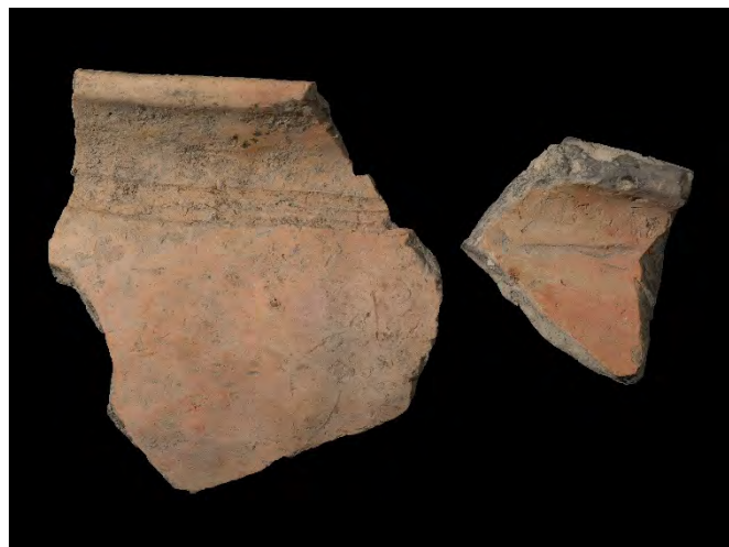
De twee randfragmenten met streepbandversiering, met vondstnummer 2405, Tritsum, Links variant Westergo Gw4d (rand met twee facetten) en rechts Gw4a, met eenvoudig randprofiel.

Vondstnummer 2405 is aangetroffen in de vulling van een iets gebogen verlopende sloot aan de noordoostzijde van de ijzertijd-terp. In het vondstenboek waarin H. Praamstra, de technische leider van de opgraving, de boekhouding bijhield, staat het nummer omschreven als vlakvondst op vlak 9. Naderhand heeft hij het toegeschreven aan een sloot, spoor 21. Het schijfje uit Tritsum komt dus vermoedelijk eveneens uit een sloot.