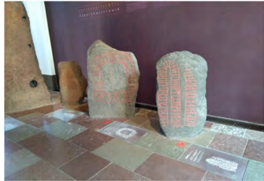
Runenstenen in het nationaal museum.

Ik heb er een afspraak met een collega-archeoloog die gespecialiseerd is in het aardewerk in deze regio. Er zijn vondsten van aardewerk in Angelsaksische stijl uit Seeland voor mij klaargezet en ik kan de documentatie van een opgraving van een groot grafveld inzien. Het schijnt één van de weinige grafvelden hier te zijn waar dit soort aardewerk voorkomt. Het materiaal uit Seeland blijkt toch echt wel anders te zijn dan dat bij ons. Het museum heeft een flinke bibliotheek, waar ik publicaties tegenkom die ik thuis nog niet heb kunnen vinden. Ik krijg een kleine privérondeleiding, met meer achtergrondinformatie en speciale aandacht voor mijn periode en de ontwikkelingen hier in Denemarken. In de vaste opstelling van het museum staan verschillende potten die voor mij van belang zijn. Eén vitrine is met name interessant. Hier staat een aantal potten per regio, van mijn periode en iets ouder, met aardewerk dat overeenkomsten vertoont met ons aardewerk in Angelsaksische stijl maar toch ook in allerlei opzichten anders is.