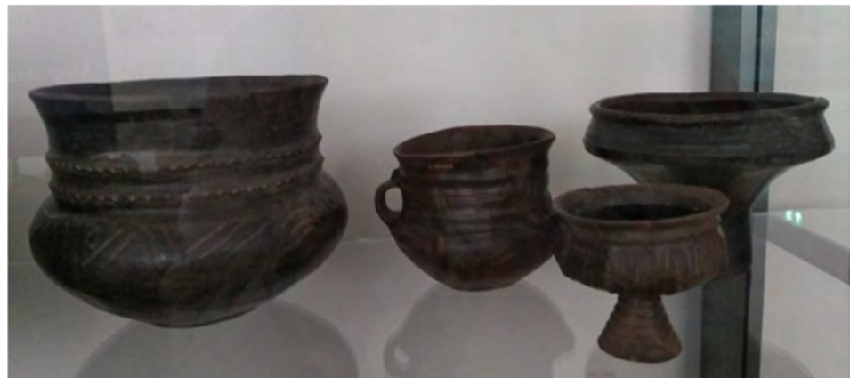
Enkele potten uit de bovengenoemde aardewerkvitrine.

Ik heb er een afspraak met een collega-archeoloog die gespecialiseerd is in het aardewerk in deze regio. Er zijn vondsten van aardewerk in Angelsaksische stijl uit Seeland voor mij klaargezet en ik kan de documentatie van een opgraving van een groot grafveld inzien. Het schijnt één van de weinige grafvelden hier te zijn waar dit soort aardewerk voorkomt. Het materiaal uit Seeland blijkt toch echt wel anders te zijn dan dat bij ons. Het museum heeft een flinke bibliotheek, waar ik publicaties tegenkom die ik thuis nog niet heb kunnen vinden. Ik krijg een kleine privérondeleiding, met meer achtergrondinformatie en speciale aandacht voor mijn periode en de ontwikkelingen hier in Denemarken. In de vaste opstelling van het museum staan verschillende potten die voor mij van belang zijn. Eén vitrine is met name interessant. Hier staat een aantal potten per regio, van mijn periode en iets ouder, met aardewerk dat overeenkomsten vertoont met ons aardewerk in Angelsaksische stijl maar toch ook in allerlei opzichten anders is.