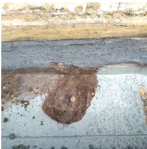
Een mestkuil in het vlak.