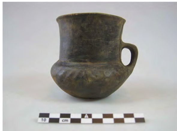
Voorbeeld van een pot uit de collectie van de de Sydvestjyske Museer. Voor ons is de hoge hals erg ongebruikelijk.

Ook hier zie ik weer dat het materiaal uit zuid-Jutland veel overeenkomsten, maar ook veel verschillen vertoont met wat bij ons gebruikelijk is. Dat soort inzichten maakte dit tot een erg leerzame reis. Het was goed om zelf het aardewerk te kunnen bekijken in plaats van af te moeten gaan op alleen aardewerktekeningen. Misschien nog wel belangrijker was het om alle onderzoekers van de verschillende musea te spreken en te horen dat er uiteenlopende meningen zijn, die niet allemaal in de literatuur terug zijn te vinden. Nu begint het eigenlijke werk: de verwerking van alle nieuwe informatie en ideeën die deze reis heeft opgeleverd.