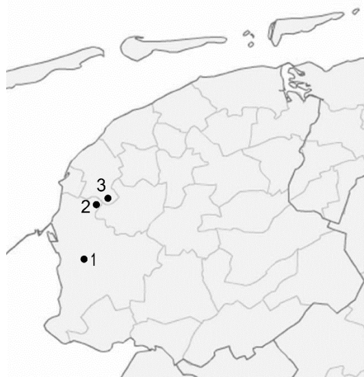
De vindplaatsen van de drie uitgesneden en doorboorde schijfjes voorhoofdsbeenen uit Friesland op een kaart met de oude gemeentelijke indeling. 1. Arkum, 2. Groot-Saksenoord, 3. Tritsum. 1. en 2: gemeente Súdwest-Fryslân, 3: tot 2018 gemeente Franekeradeel, daarna gemeente Waadhoeke.

De vindplaatsen van de drie vondsten liggen alle in de westelijke helft van Friesland, op korte afstand van elkaar: van Arkum naar Groot-Saksenoord is 11 km, van Groot-Saksenoord naar Tritsum 2 km. Uit andere delen van het terpen- en wierdegebied zijn deze schijfjes niet bekend. Een oproep op de internationale e-maildiscussielijst ZOOARCH wie dergelijke schijfjes elders had gezien, leverde geen resultaat op. Voorlopig houden we het erop dat het maken van deze schijfjes een specialiteit is voor dit deel van Friesland in de late ijzertijd. Dan de vraag: wat deed men met deze schijfjes. Prummel & Hullegie opperden dat het uitsnijden van de schijfjes uit het voorhoofdsbeen, het doorboren en het in een sloot werpen als geheel een magische of rituele handeling vormde. Dit kan ook voor het schijfje uit Tritsum hebben gegolden.