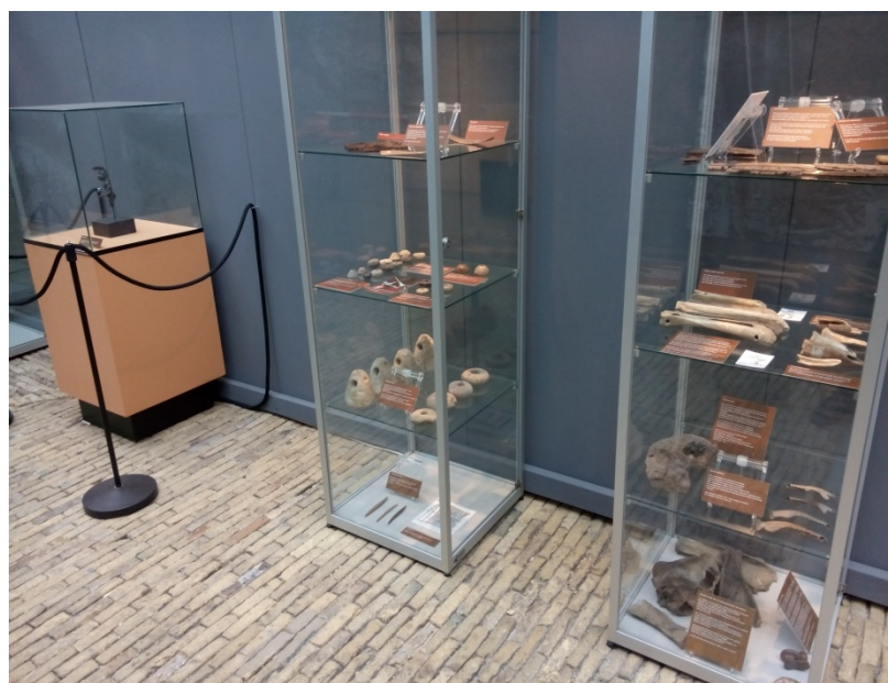
De vitrines met voorwerpen uit het Noordelijk Archeologisch Depot in Nuis en links het Mercuriusbeeldje van het Fries Museum.

Het Natuurmuseum richtte de tentoonstelling in, waarvoor de terpenvereniging inhoudelijke informatie verschafte: hoe zagen de huizen eruit, welk aardewerk gebruikten de mensen, welke dieren en gewassen had men etc. Dankzij een bruikleen van het Noordelijk Archeologisch Depot in Nuis konden ook echte voorwerpen worden getoond, zoals aardewerken potten, textiel, weefgewichten en benen werktuigen zoals benen schaatsen. Het Fries Museum leende een Romeins bronzen Mercuriusbeeldje uit en ADC Archeoprojecten (Amersfoort) leverde foto's van de opgraving Oldehoofsterkerkhof in Leeuwarden, die groot afgedrukt werden getoond.