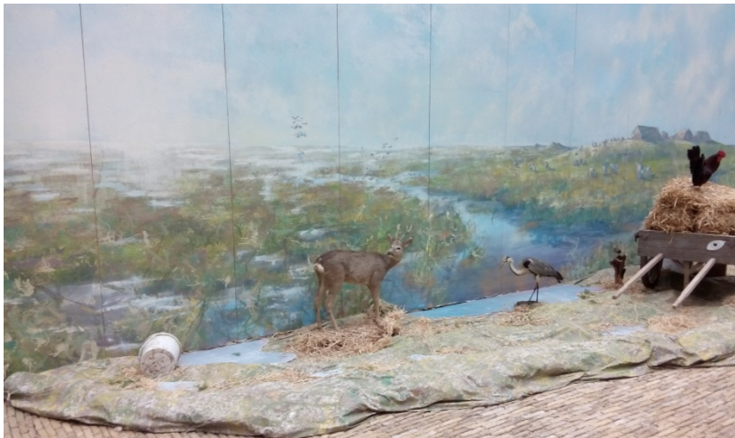
De schildering van het kwelderlandschap met enkele bewoners: ree, reiger en (vanaf de Romeinse tijd) kippen.

De tentoonstelling vond plaats in de overdekte binnenplaats van het museum, het zogenaamde atrium. De bezoekers kwamen binnen via een tijdmachine, waarin zij 250 pakes en beppes terug gingen in de tijd. Het eerste dat zij daarna zagen was een grote geschilderde wand met een reconstructie van een kwelderlandschap met daarin een aantal hoge terpen. Het ongerepte kwelderlandschap op de schildering komt niet geheel overeen met hoe we nu denken dat het bewoonde kwelderlandschap eruit zag, namelijk met veel sloten, akkers en een sterk begraasde kwelder), maar het was wel een mooie schildering.