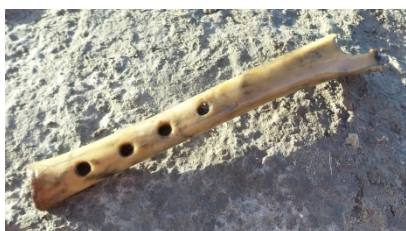
Fluitje gemaakt van een schapenbot.

De opgraving leverde een grote hoeveelheid vondsten en sporen op. Er zijn sloten, paalkuilen en kuilen gevonden die verband houden met de bewoning op de terp. Op basis van een voorlopige datering van het aardewerk en de metaalvondsten dateren de sporen uit de vroege middeleeuwen (vanaf de 8e eeuw) tot met de 12e eeuw. Tot de vondsten behoren vooral veel aardewerkscherven, met name van middeleeuwse kookpotten, maar er zijn ook enkele scherven uit de IJzertijd/Romeinse tijd gevonden. Ook zijn er veel dierenbotten gevonden afkomstig van slachtafval.