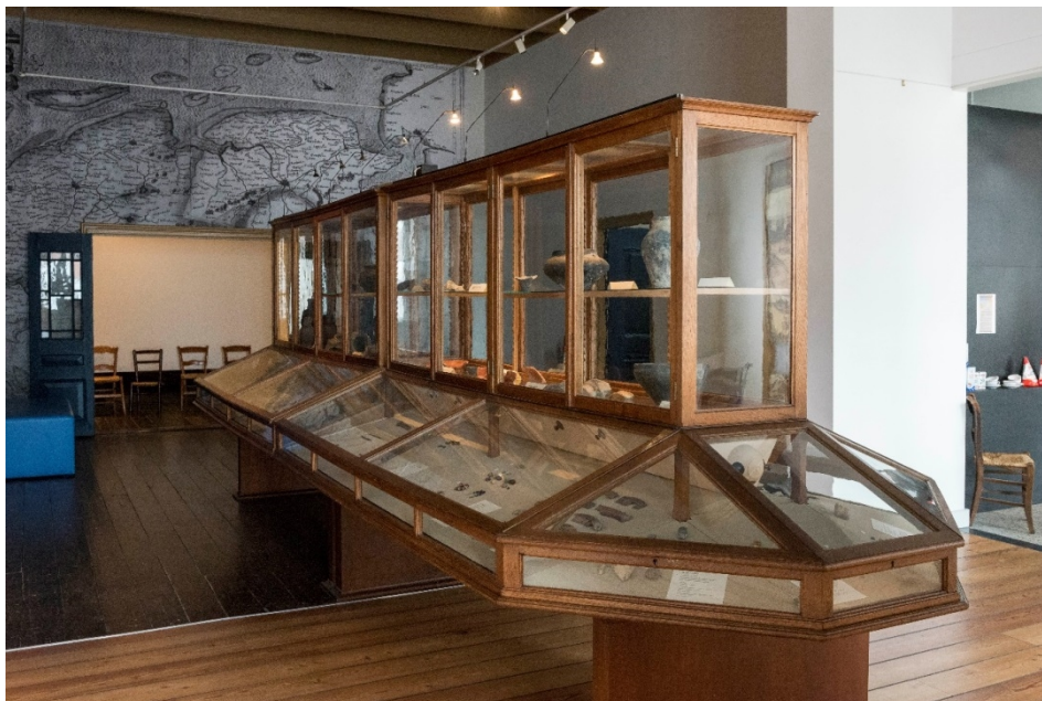
De Collectie Mensonides in het Openluchtmuseum Het Hoogeland, Warffum.