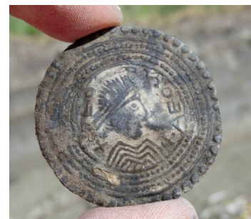
Bronzen pseudomuntfibula, 9e-11e eeuw.

De opgraving die vanaf 18 april ten zuidoosten van Midlum werd uitgevoerd, was nodig vanwege de aanleg van de nieuwe N31 bij Harlingen. Het tracé van de nieuwe weg raakt de flank van een middeleeuwse terp en zou de archeologische resten vernietigen. Daarom heeft Ballast Nedam voorafgaand aan de werkzaamheden voor de aanleg van de nieuwe N31 archeologisch onderzoek laten uitvoeren. De opgraving, uitgevoerd door RAAP, was een vervolg op een eerder booronderzoek en proefsleuvenonderzoek.