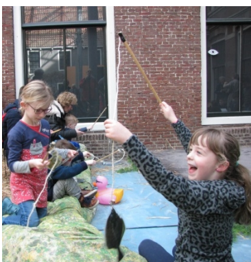
Een meisje heeft een platvis aan de haak geslagen (foto Petra van der Tuin, Natuurmuseum Fryslân).

De volgende opdracht was het hengelen van vissen met een magneetje, en het determineren van de vissen aan de hand van voorbeelden aan de muur. De vissoorten in de 'priel' waren soorten die regelmatig in terplagen worden gevonden: o.a. paling, schol, kabeljauw, geep. Daarna kwam het zelf opgraven van archeologische vondsten aan bot. Deze waren verborgen in een zandbak. De kinderen hadden er veel plezier in de vondsten in het zand te zoeken en ze te determineren met de voorbeelden aan de muur. Hier hing ook een monitor waarop de paleogeografische reconstructies van Noord-Nederland en Noordwest-Duitsland van Peter Vos en Egge Knol werden getoond. Als ook deze opdracht klaar was, hadden ze al drie stempels verdiend.