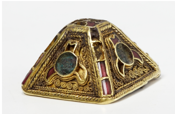
De piramidale knop van Ezinge.